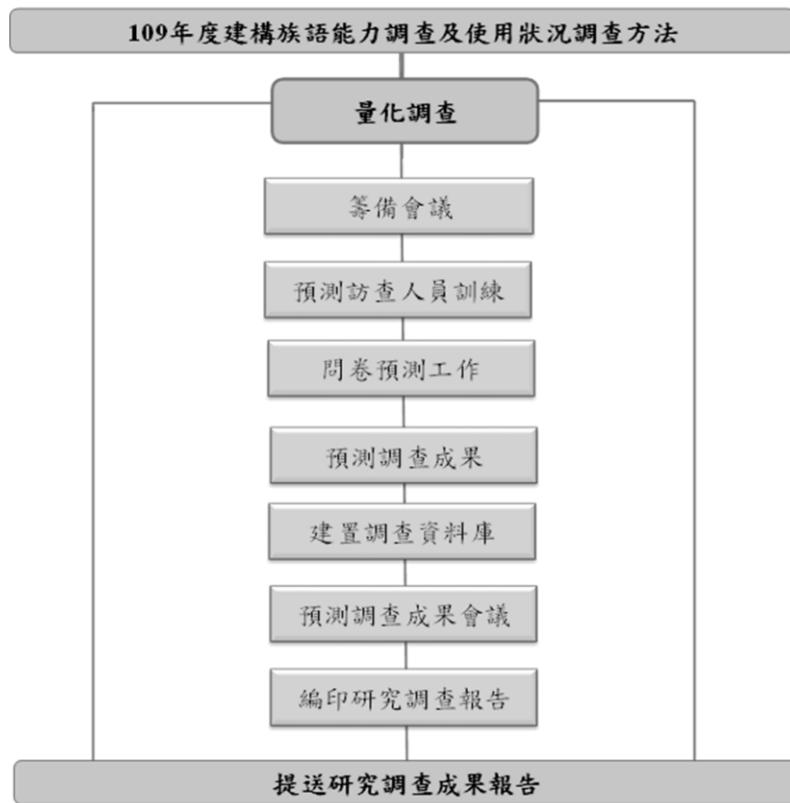
圖 1 研究流程

為了調查台灣原住民各族不同世代之族語能力、語言使用及使用態度，藉以瞭解各族之語言活力，並針對語言流失之程度，採取有效的振興方法，財團法人原住民族語言研究發展基金會(以下簡稱原語會)本次會同專家學者及各族族人共同研商討論族語調查方法及問卷內容，並辦理「109 年度建構族語能力調查及使用狀況調查方法」問卷預試，以量化調查方式針對設籍臺灣地區之 10 歲以下、11-20 歲、21-30 歲、31-40 歲、41-50 歲、51-60 歲、61 歲以上原住民進行一對一面對面訪問。就預測過程結果，提送原語會討論，再依會議決議修正後實施後續調查工作。