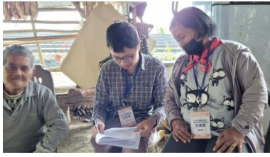
表 11 現場實際訪問狀況