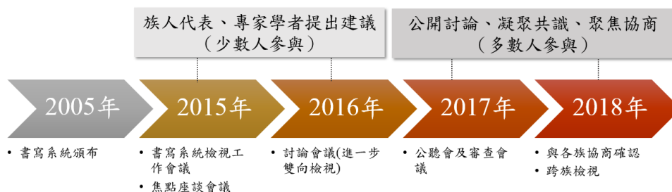
圖 1：2015 年至 2018 年書寫系統檢視及修訂討論歷程